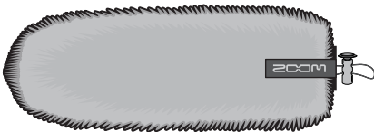
WSU-2 Bonnets anti-vent à poils